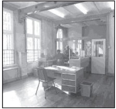
Interieurfoto's van het oude postkantoor in de gebruikperiode.