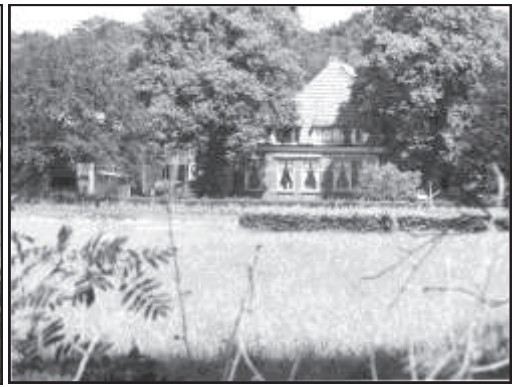
De pachtboerderijen aan de Werkhorstlaan: Immer Moed (links) en Werkhorst.

Een andere naam in het oostelijke gedeelte van de Kolonie 7 is Noorwegen . Dit perceel ligt aan de oostkant van de weg van Doldersum naar Boijl ter hoogte van het zojuist genoemde Jodenkerkhof. De medewerkers van de Maatschappij van Weldadigheid hanteren tegenwoordig geen namen maar nummers voor de percelen. Vaknummer 5 omvat het gebied met de naam Hilgert en Jodenkerkhof. Noorwegen heeft nu bijvoorbeeld vaknummer 8 en vaknummer 9 komt overeen met de Ossenkamp en het Wijkmeesterbosch. De Eendenkooi heeft nu vaknummer 19.