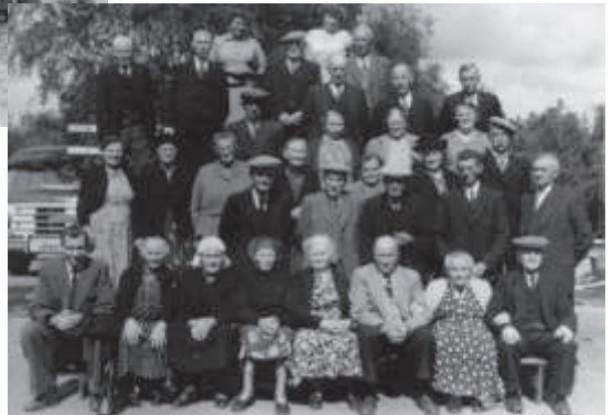
Rechts: Een reis met de “ouden van dagen” op 23 augustus 1956. (foto archief A.K. Bovenkamp, zie ook sledderker-spel.nl voor de namen).

klik op de foto voor een hogere kwaliteit