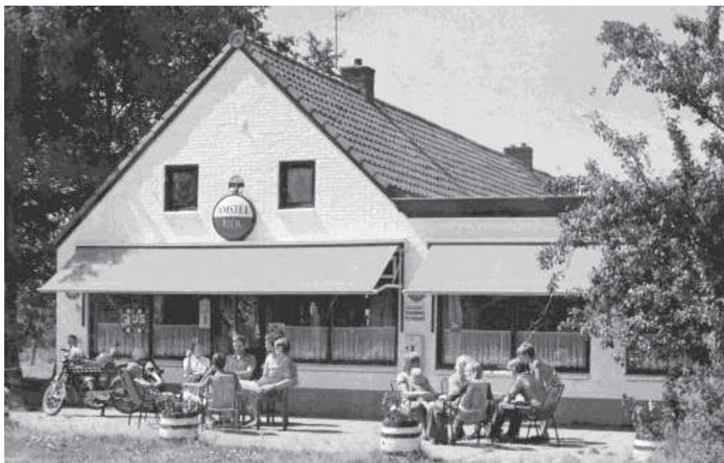
Het ouderlijk huis Café Veldhuizen in 1976.