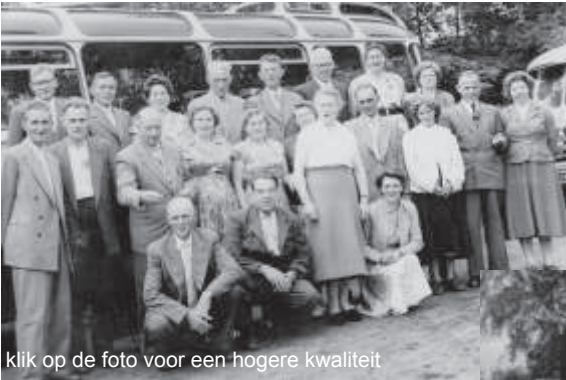
Links: “Heideroosje” op reis in 1950.

geleidsters mee. Bij thuiskomst stond het fanfarekorps “Concordia” uit Frederiksoord de bus op te wachten. Het hele dorp was dan uitgelopen. Al die bejaarde mensen waren in het zwart gekleed, de mannen in een net pak en de