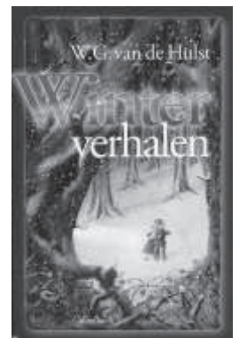
W.G. van de Hulst boekjes.