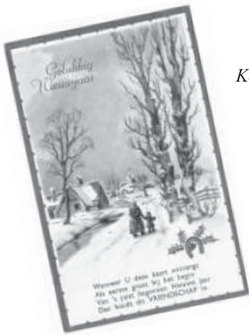
Kerst- en Nieuwjaarskaarten