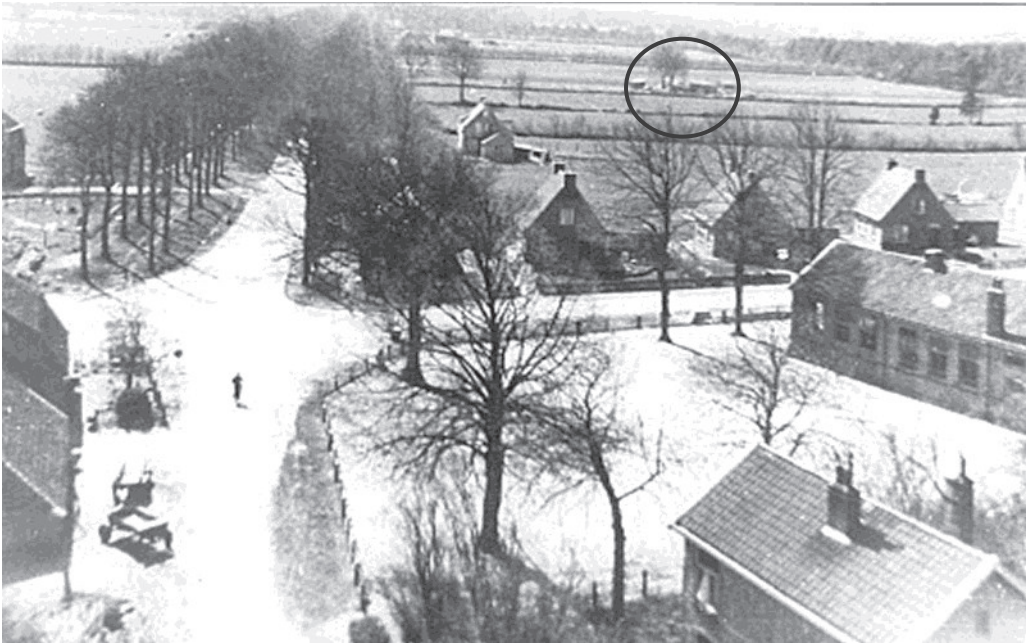
Figuur 1. Op deze foto van Tiemen Stuiver uit 1953 zijn de armenkamertjes in de achtergrond nog zichtbaar.

instellingen 2 – werkten nauwelijks samen en hadden een chronisch geldgebrek. Een aanpassing van de Armenwet in 1912 veranderde in feite niets. Armenzorg bleef primair een taak van kerkelijke liefdadigheid, gevolgd door die van de particulieren, terwijl de gemeente-instellingen een bijna ‘slaperdijkrol’ bleven innemen. Subsidiar ondersteunen was prima, mits aan verschillende voorwaarden was voldaan en waar mogelijk werd verhaal gehaald. Bloed- of aanverwanten werden aangesproken tot teruggave van het geleende (!) bedrag of eventueel werd de ondersteuning als loon voor arbeid beschouwd. Ook nalatenschappen bleven bronnen voor terugbetaling.