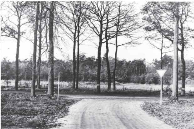
Figuur 5. Vanaf de Wildwal zien we achter de bomen nog de restanten van de armenkamertjes na de afbraak in 1963.

“... Op perceel B2994 staat een goed onderhouden woning, waarin woonruimte voor 3 gezinnen ...”, vermeldt de toelichting op een taxatierapport 24 november 1961 van de Rijkstaxateur Weggemans. Het betreft het armenhuis waarin op dat moment nog twee gezinnen verblijven. Wat ook de toestand van het huis mag zijn, een nieuwe tijd van rentabiliteit en efficiency is aangebroken waarin grond veel geld gaat opleveren. Met de sloop van het armenhuis in 1963 eindigt bijna een eeuw later het proces van de ‘klassieke’ armenzorg in Vledder en wordt bijstandsverlening een recht. De Algemene Bijstandswet van 1965, reeds in 1963 toegepast, was formeel een feit geworden. Maar het hebben van een dak boven je hoofd is anno 2016 nog steeds geen recht geworden. De overheid heeft een actieve inspanningsverplichting, terwijl de liefdadigheid van kerkelijke en civiele instellingen op het tweede plan is geplaatst en heden ten dage een bijna dwingend beroep wordt gedaan op het ‘leger’ van de individuele vrijwilligers. Want leniging van nood is nog lang niet verdwenen. Wat weg is, is het symbool van armoede: armenkamertjes, of zo u wilt, het armenhuis.