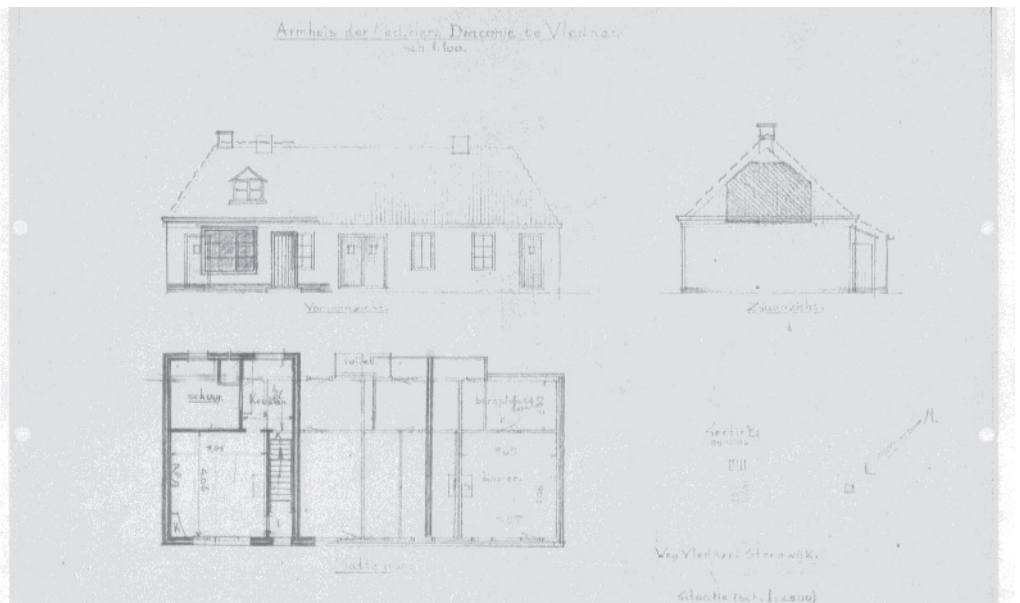
Figuur 2. Armhuis der Ned. Herv. Diaconie te Vledder. Dit is de bouwtekening van de middelste woning welke is opgesplitst in twee woningen. (Zie de vier deuren in het vooraanzicht).

tjes'. Via de voordeur stapte men direct in de woon-, tevens eet- en slaapkamer van 3.65 bij 4.06 meter. Deze woonkamer had aan de voorzijde een raam van nauwelijks 70 cm breed en minder dan 140 cm hoog. Aan de achterzijde van de kamer bevonden zich de keuken en bergplaats. Alle gezinnen moesten het doen met één gemeenschappelijke w.c. die in het midden achter tegen het pand was gebouwd. Waterleiding en elektriciteit waren niet aanwezig. Midden voor het huis bevond zich een waterput.