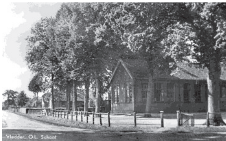
De “oude school”.