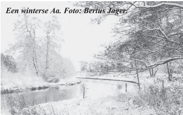
Een winterse Aa.

stonden we na verloop van enige tijd met de klompen vol water zodat we de sokken moesten uitwringen. We hebben zelfs wel eens een vuurtje gestookt in “de Kokse Bargen” om de sokken te drogen en thuis niet te hoeven opbiechten dat we weer eens natte voeten hadden opgelopen.