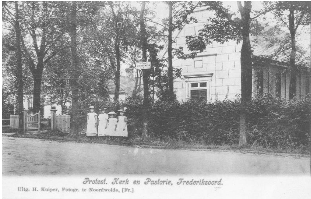
Protest. Kerk en Pastorie, Frederiksoord.