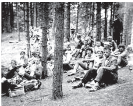
Op schoolreis naar Vlieland: het Doniahuis. Rechts uitrusten na een spelletje blikspuit.

Verder ontdekten ze pokkenbriefjes die je vroeger nodig had om te worden toegelaten tot de school. Absentieboeken waren deze morgen in te zien. Leuk om daarin je eigen naam te vinden.